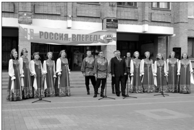
Уважаемые работники культуры и ветераны отрасли!

Примите самые теплые и сердечные поздравления с профессиональным праздником - Днем работника культуры!